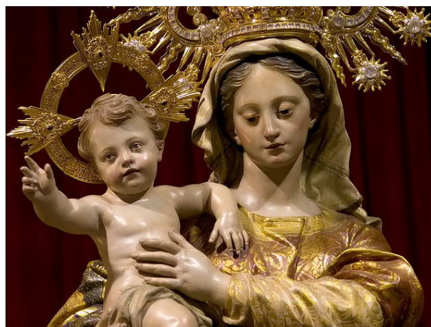
Figura 1. Imagen de cerca de la Virgen de las Maravillas dentro.

conuento, todo con la música. Testó ante Fulgencio Tauste, escribano” 31 .